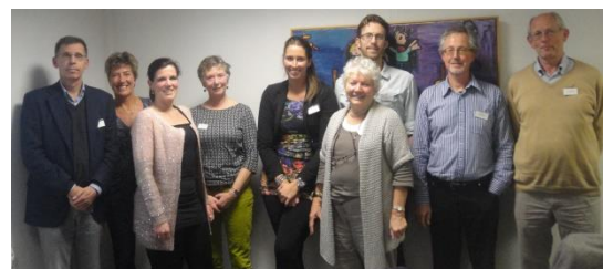
Het medisch team dat in januari/februari 2014 operaties zal verrichten