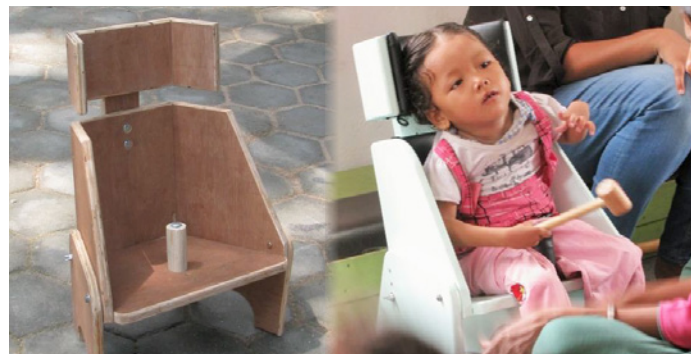
Een stoel uit een reeks speciale meubelen voor IMC-kinderen

Succesrijke neurologische behandeling is sterk gebaat bij een vroegtijdige behandeling van de jongste kinderen. Van groot belang is ook de continuïteit van behandelen. Ouders moeten leren dagelijks aandacht te besteden aan de juiste houdingen van hun kind in de thuissituatie. In samenwerking met de Congolese overheid werken we aan de oprichting van 'schoolklasjes'. In deze klasjes worden de kinderen en hun ouders geïnstrueerd. Met de klasjes onder leiding van Congolese kinés wordt continue aandacht mogelijk. Daarnaast zijn de klasjes efficiënter doordat meerdere kinderen en hun ouders tegelijkertijd geïnstrueerd kunnen worden.