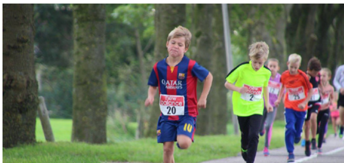
Foto van de sponsorloop in 2015