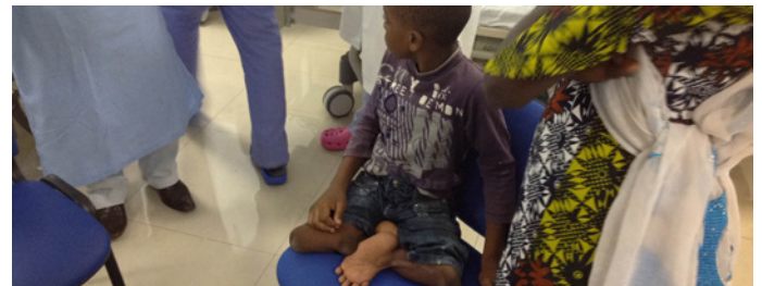
Het patiëntje met onmiskenbare orthopedische afwijking