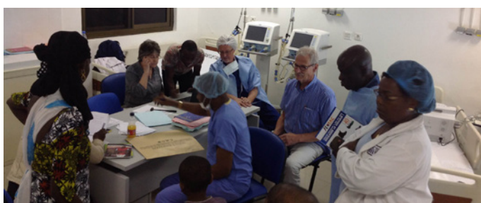
Voorbespreking orthopedische operatie van een kind

Een orthopedische equipe is net teruggekeerd. Afgelopen mei heeft het chirurgisch team een aantal patiëntjes geopereerd. Ook deze missie legde het accent op training van