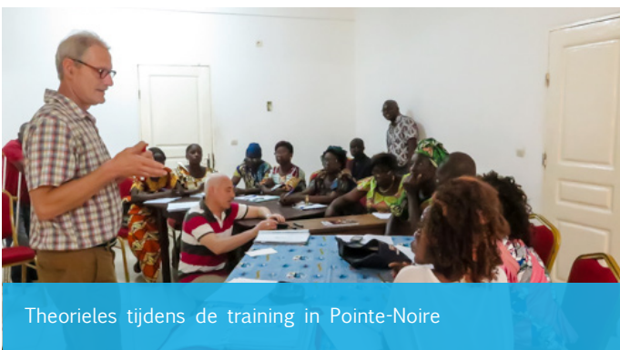
Theorieles tijdens de training in Pointe-Noire

Cerebrale parese (CP) betreft hersenbeschadiging – vaak ontstaan bij de geboorte – waarbij allerlei vormen van neurologische uitval optreden. Dit kunnen zowel geestelijke als fysieke stoornissen zijn, en zowel motorische stoornissen als bijvoorbeeld blindheid. In de Franstalige wereld is de afkorting IMC gangbaar. De zorg voor deze groep patiëntjes moet in Congo-Brazzaville bijna van de grond af opgebouwd worden. Gebruikelijk is dat kinderen met neurologische beperkingen verborgen worden gehouden en daardoor in een sterk isolement moeten leven. Kinderen met cerebrale parese zijn weliswaar niet te genezen, wel is het mogelijk en wenselijk hun kwaliteit van bestaan te verbeteren. Alleen al op vlak van liggen, staan en zitten, dus van houding, is aanzienlijke verbetering mogelijk. Ook gaat aandacht uit naar (leren) spreken en andere ontwikkelingsaspecten.