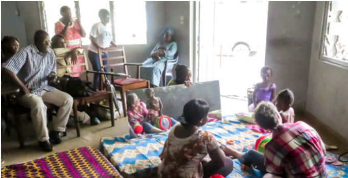
Praktijkles met een moeder en haar IMC-kindje

Een equipe van fysiotherapeuten verzorgde afgelopen maart in de steden Brazzaville en Pointe-Noire trainingen voor Congolese collega-behandelaars. De theorielessen en workshops zijn gericht op de behandeling van kinderen met cerebrale parese.