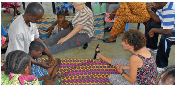
Een cursusdag van de neurologische equipe in Brazzaville, oktober 2016

Op verzoek van de Congolese regering is Stichting Op Gelijke Voet in 2015 begonnen met een behandelprogramma voor kinderen met hersenbeschadiging . Rondom deze kinderen heerst een cultuur van schaamte en angst. Hierdoor worden ze vaak weggestopt en leven ze in erbarmelijke omstandigheden.