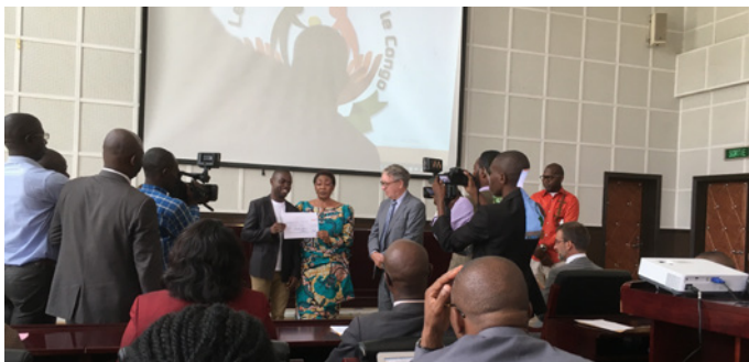
De ontwerper van het beeldmerk van de prijs ontvangt een cheque.

Leendert vindt het vooral belangrijk dat mede dankzij deze prijs de vooroordelen over CP-kinderen in Afrika worden verminderd en dat meer wordt gedaan aan de verbetering van hun levensomstandigheden.