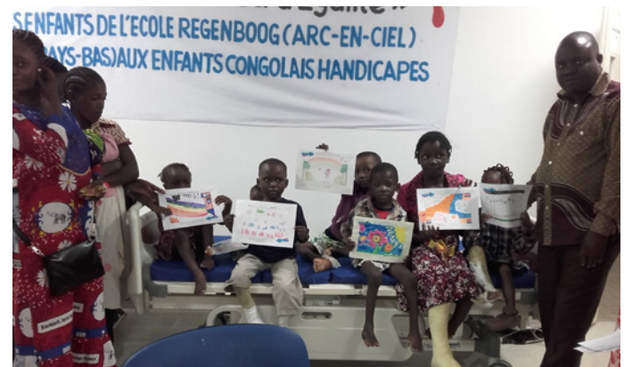
Patiëntjes tonen de tekeningen van De Regenboog.

vooroordelen: ze zouden bekeerd kunnen zijn en daardoor levensgevaarlijk voor anderen. Onze equipeleden hebben al veel van deze kinderen uit de verborgenheid weten te halen. We zijn volop bezig om Congolese (assistent-)therapeuten en de ouders goede behandelmethoden voor deze groep kinderen te leren. En dat werkt! De eerste oudervereniging is al opgericht en ook het ministerie begint zich nu met deze groep te bemoeien.