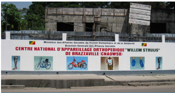
Muurschildering langs het Willem Struijs Centrum.

In het Centre National d'Appareillage Orthopédique Willem Struijs de Brazzaville worden prothesen, orthesen en orthopedische schoenen vervaardigd. Verstandelijk gehandicapte jongens assembleren er mechanische driewielers.