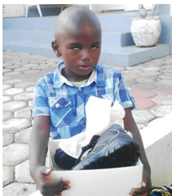
Blinde jongen met nieuwe schoenen