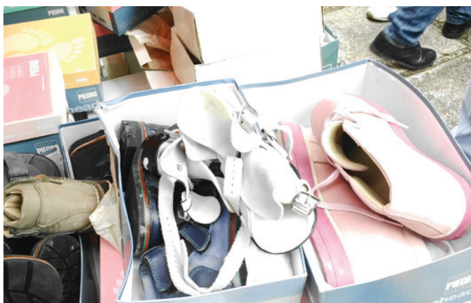
Deel van de gezonden partij

De container die Stichting Op Gelijke Voet had laten afleveren, bevatte verschillende door sponsors beschikbaar gestelde goederen. Het Reinier de Graaf Ziekenhuis uit Delft gaf gips mee, de Rijksuniversiteit Utrecht een skelet waar Congolese studenten fysiotherapie mee kunnen oefenen. Ook enkele machines voor de fabricage van arm- en beenprothesen konden worden overhandigd.