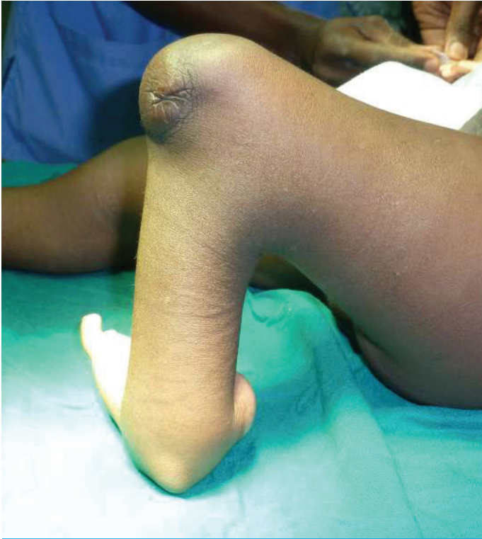
Dit kind met een klompvoet is op de knie gaan lopen. Vroegtijdig behandelen voorkomt deze situatie.

Klompvoetjes komen in Afrika zo'n acht keer meer voor dan in Europa. Bovendien wordt in Europa bij zo'n kindje meteen na de geboorte begonnen met correctie en gipsbehandeling. In Afrika gebeurt dat vrijwel nooit, zodat baby's die met een klompvoetje ter wereld komen er meestal levenslang door worden beperkt.