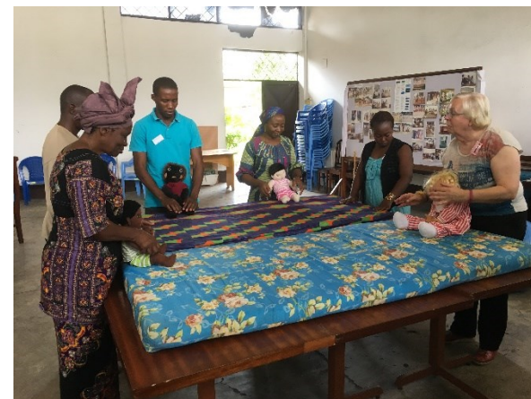
Training locale paramedici