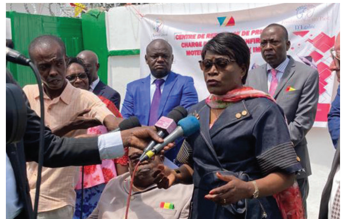
Minister Irène Mboukou geïnterviewd door de Congolese televisie.

Een mooie bonus voor de groepen van zorgwerkers in Brazzaville en Pointe-Noire was dat onze stichting hun op 3 december Wereld Gehandicaptendag een aanmoedigingsprijs kon uitreiken: de Prix Leendert Struijs pour des Enfants Handicapés. Het toegekende geldbedrag is bestemd voor voorlichting en bewustmaking, zowel gericht op ouders, overheidsinstanties als het bredere publiek. Dat is in de Republiek Congo wel noodzakelijk. Nog te veel CP-kinderen – vooral in de binnenlanden – worden verwaarloosd of moeten een nog erger lot ondergaan.