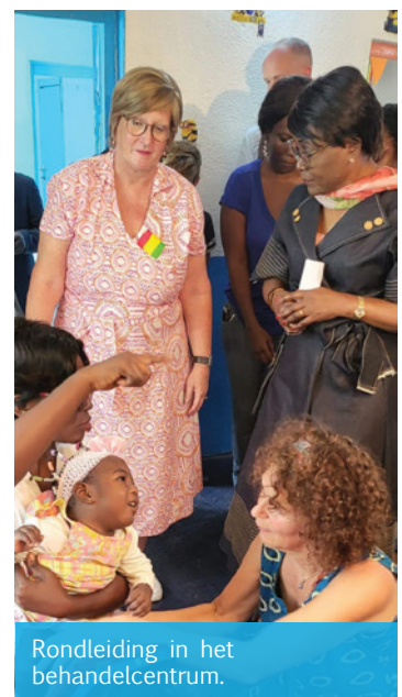
Rondleiding in het behandelcentrum.

Het orthopedische project in Gatagara in Rwanda is zeer succesvol geweest. Momenteel is de vraag wat dit orthopedische ziekenhuis nog precies nodig heeft van onze kant. In ieder geval is voor in juni dit jaar nog een missie gepland. Ook heeft het bestuur al besloten een financiële bijdrage te leveren aan de opleiding van een aan het ziekenhuis verbonden arts tot orthopedisch chirurg. In de loop van dit jaar zullen een aantal knopen worden doorgemaakt.