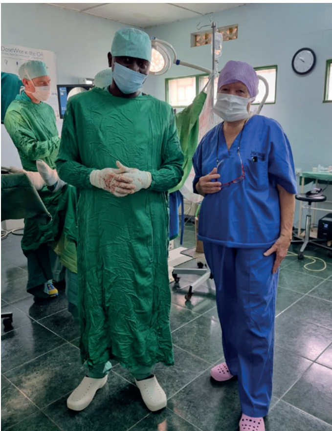
Samenwerking op de operatiekamer.

De missie naar Rwanda van medio november 2022 was een zogenoemde prospectiemissie. Er is gekeken welke behoeften het ziekenhuis in Gatagara precies nog heeft. Of er ook andere typen operaties nodig zijn, zoals aan rug en schouder. De Rwandese artsen hadden laten weten dat ze wilden leren heup- en knieprotheses te plaatsen. Later zou helaas blijken dat dit laatste niet mogelijk was, omdat de operatiekamer en de ziekenzalen niet voldeden aan de hoge standaarden van steriliteit en hygiëne voor het