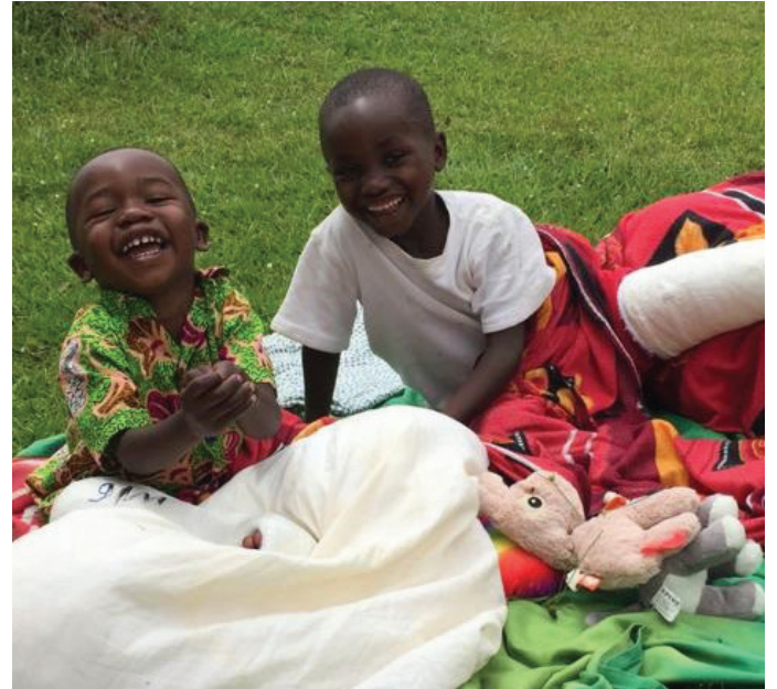
Geopereerde patiëntjes op het grasveld voor het ziekenhuis.